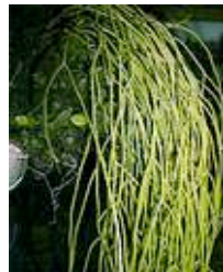
Isolée de mousses du genre Lycopodium sieboldii