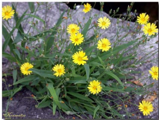
Extrait d' Ixeris chinensis Nakai